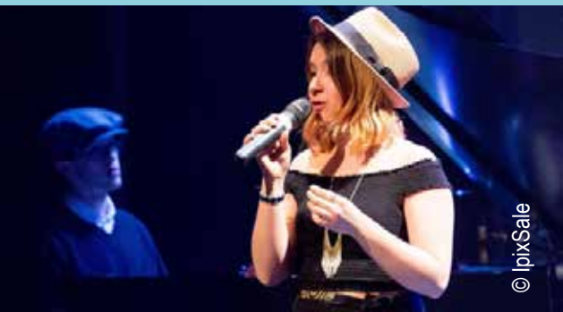
Participants aux finales régionales du programme Secondaire en spectacle 2016 - région de Montréal

Cette année, les lauréats des finales régionales ont représenté la région de Montréal au Rendez-vous panquébécois (RVPQ). La ville d'Amos accueille pour une seconde fois les participants du 27 au 30 mai 2016. La délégation montréalaise est formée de 44 jeunes et 10 accompagnateurs.