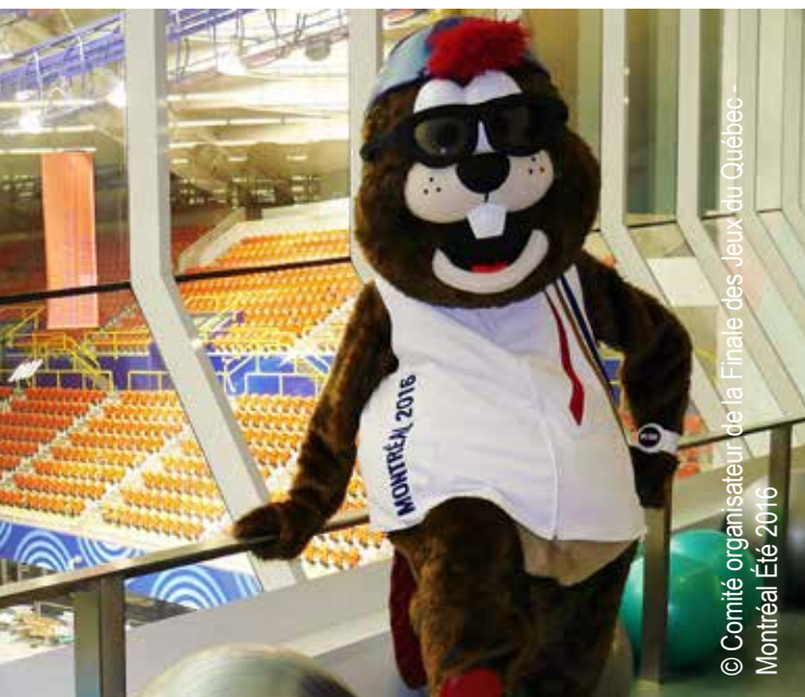
La mascotte de la Finale des Jeux du Québec 2016 Hourra